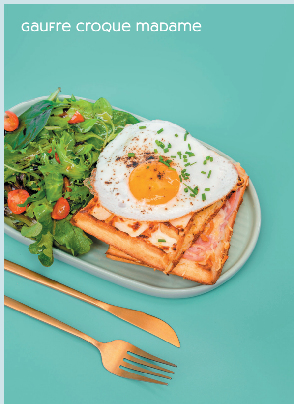
gaufre croque madame