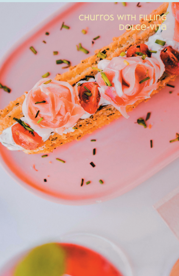
CHURROS WITH FILLING DOLCE-VITA