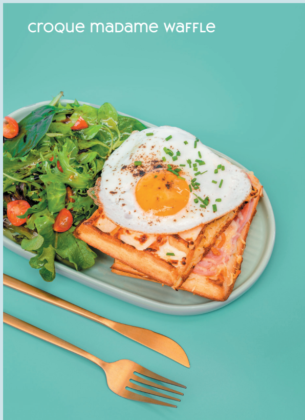
CROQUE MADAME WAFFLE