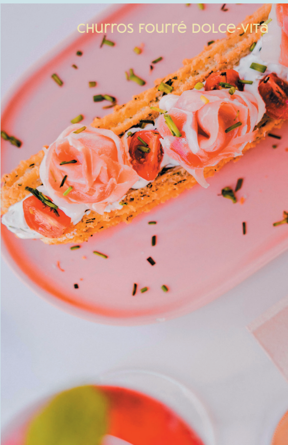
churros fourré dulce-vita